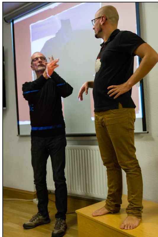
Abteilung Wandern dankt für den interessanten Bericht