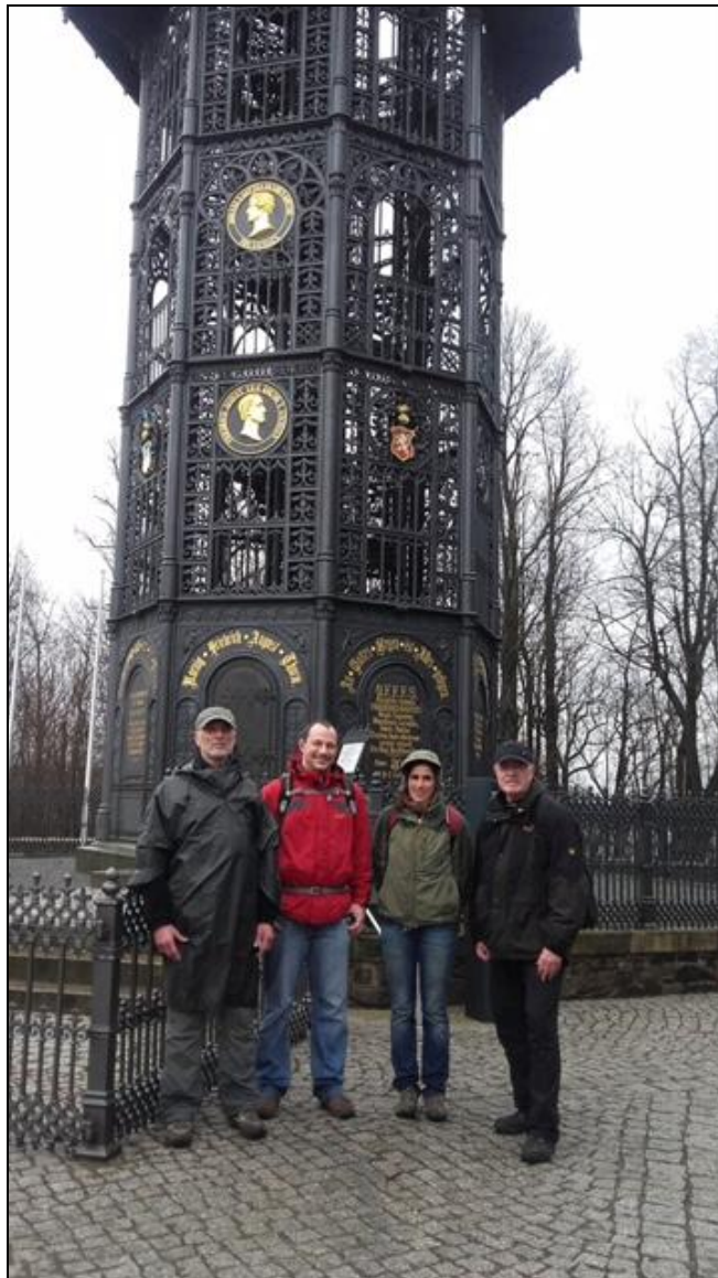
Auf der Rückkehr zur Backsteinernen Nikolaikirche, König-Albert-Bad, Markt und Breitschneider-Haus vorbei zum Löbauer Bahnhof.