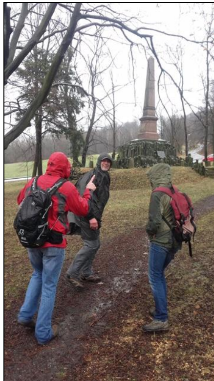
Siegesdenkmal im Friedenhain 13m hoch